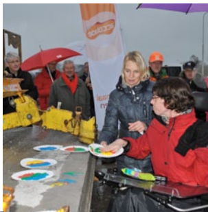
Bij de start van de bouw werden symbolische, kleurrijke handtekeningen gezet door betrokkenen.