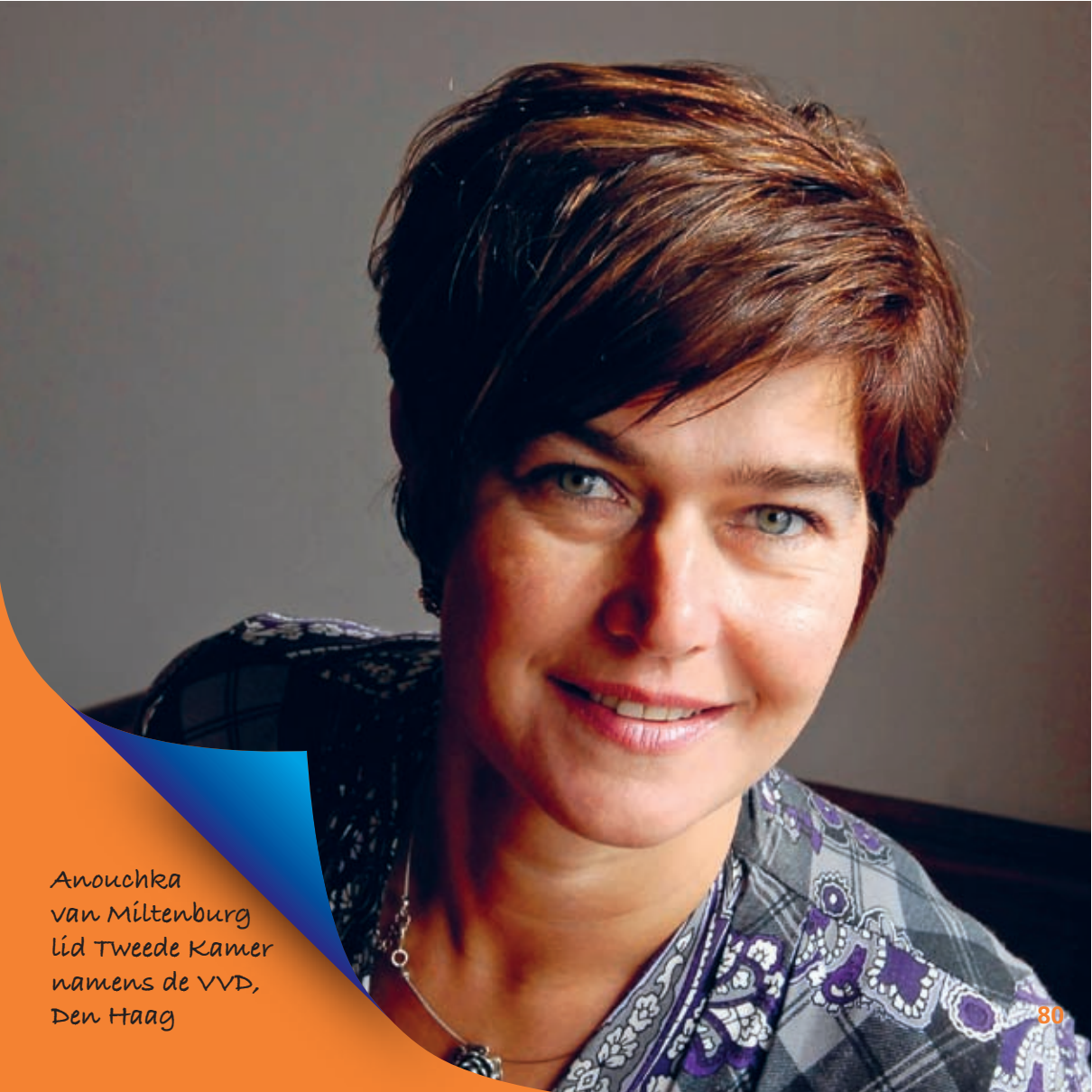
Anouchka van Miltenburg lid Tweede Kamer namens de VVD, Den Haag